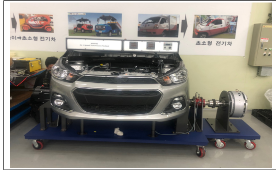
Figure 2. EV 2-speed transmission Test bed

※ 이 논문은 2018년도 중소기업벤처부의 재원으로 광역협력권산업육성사업의 지원을 받아 수행된 연구임 “경량소재를 적용한 힐 홀드 기능 일체형 파킹 시스템 장착 도심형 전기 상용차용 2단 감속기 개발”(P0006102)